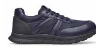
CPU KURT BLU 41/46