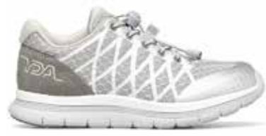
C1D YDAW15 SILVER 35/41