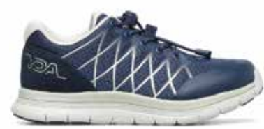
C1Y YDAW15 NAVY 35/47