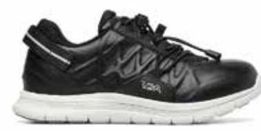
C1Y YDAW20 BLACK/WHITE 35/47