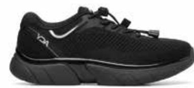
C1Y YDAC20 BLACK 36/46