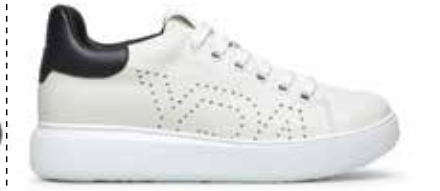
CPY VALLEY BIANCO 35/46

CALZATA MEDIA: 11 (DA 35 A 40) / CALZATA MEDIA: 11 (DA 41 A 46) *Le misure sono rilevate in cm sulle forme in plastica.