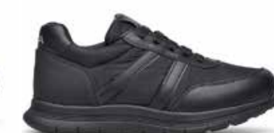
CPY KURT NERO 35/46