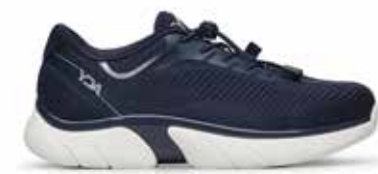
C1Y YDAC20 NAVY 36/46

CALZATA MEDIA: 10 (DA 36 A 40) / CALZATA MEDIA: 11 (DA 41 A 46) *Le misure sono rilevate in cm sulle forme in plastica.