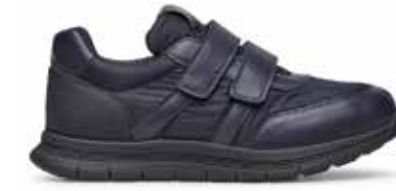
CPY YUMA BLU 35/46

CALZATA MEDIA: 12 (DA 35 A 40) / CALZATA MEDIA: 12 (DA 41 A 46) *Le misure sono rilevate in cm sulle forme in plastica.