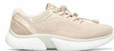
C1D YDAC20 ROSA 36/41