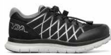
C1Y YDAW15 BLACK 35/47