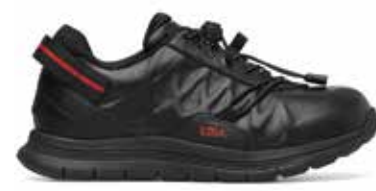
C1Y YDAW20 BLACK/RED 35/47

CALZATA MEDIA: 11 (DA 35 A 40) / CALZATA MEDIA: 12 (DA 41 A 47) *Le misure sono rilevate in cm sulle forme in plastica.