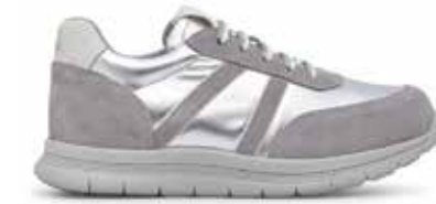
CPD KURT ARGENTO 35/41