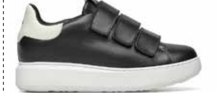
CPD LAND NERO 35/40