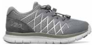
C1Y YDAW15 GREY 35/47