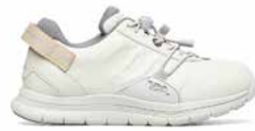
C1Y YDAW20 GREY 35/47