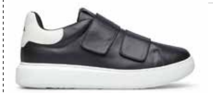
CPU LARS NERO 41/46